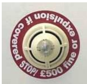
Image 2 détecteur de fumée/chaaleur dans la pièce